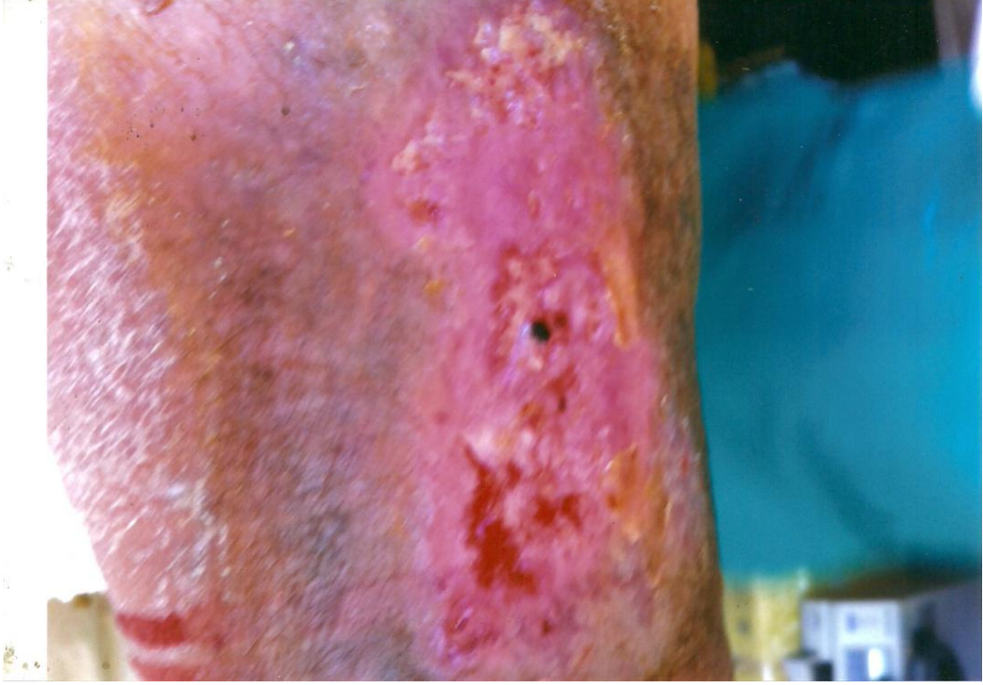
PALINGEN İLE TEDAVİDEN SONRA 1° HAFTA