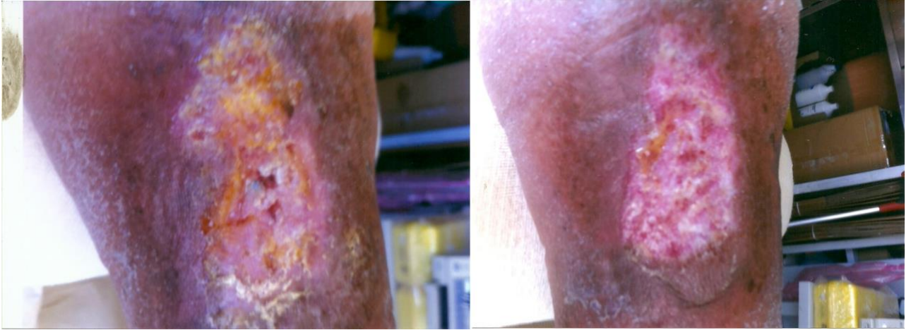
PALINGEN İLE TEDAVİDEN SONRA 2° HAFTA