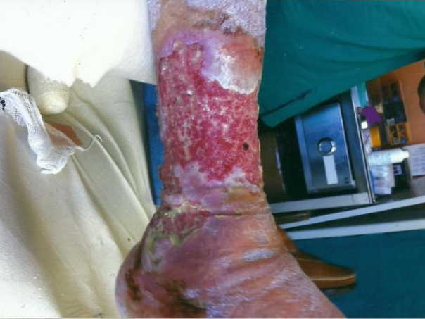
PALINGEN İLE TEDAVİDEN SONRA 3° HAFTA