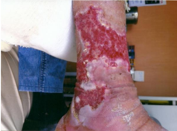
PALINGEN İLE TEDAVİDEN SONRA 5° HAFTA