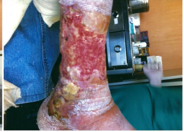
PALINGEN İLE TEDAVİDEN SONRA 2° HAFTA