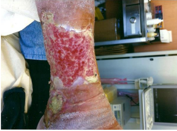
PALINGEN İLE TEDAVİDEN SONRA 1° HAFTA