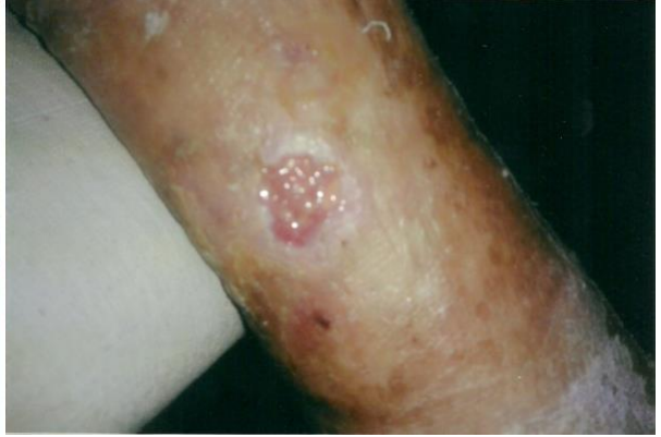
PALİNGEN İLE TEDAVİDEN SONRA 3° HAFTA