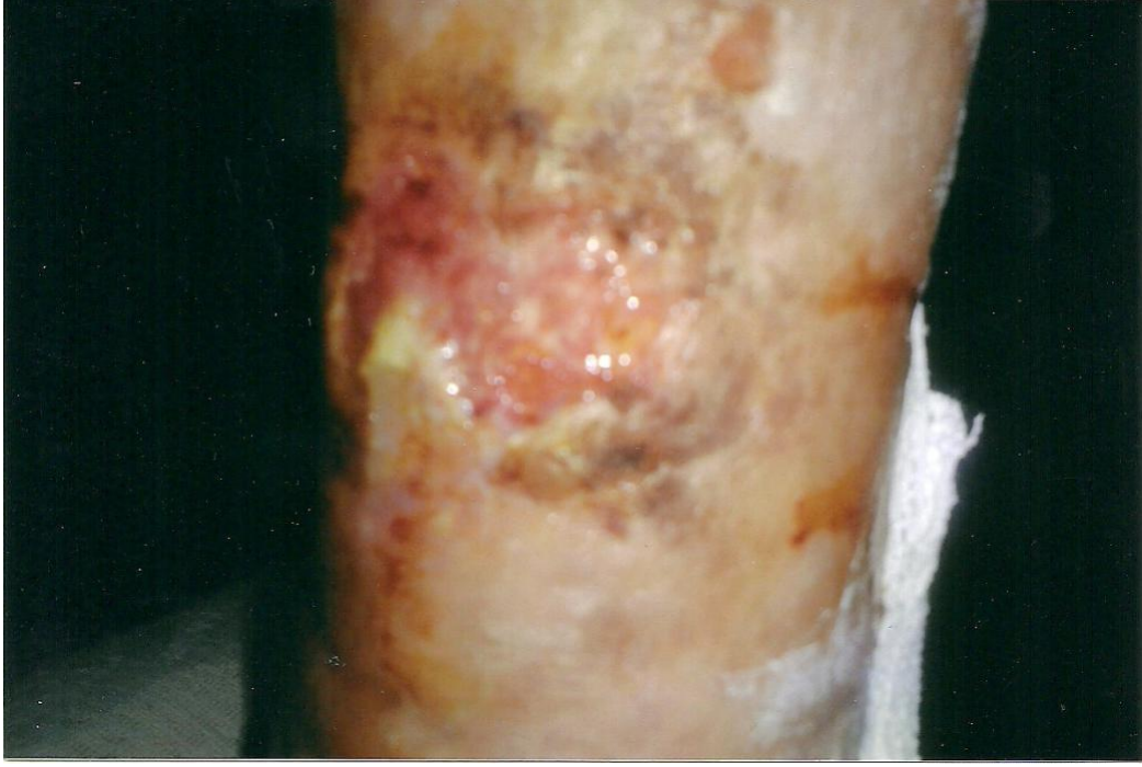
PALİNGEN İLE TEDAVİDEN SONRA 1° HAFTA