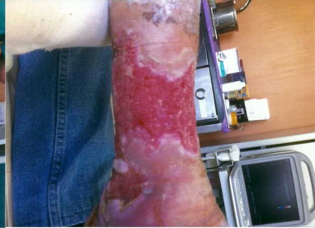
PALINGEN İLE TEDAVİDEN SONRA 4° HAFTA